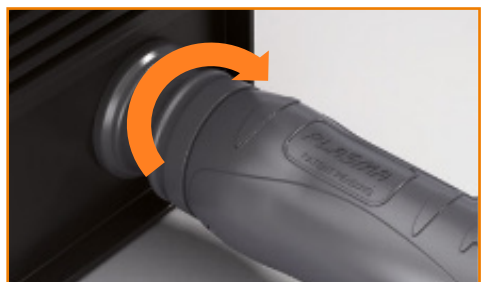
A vágópisztoly csatlakoztatása