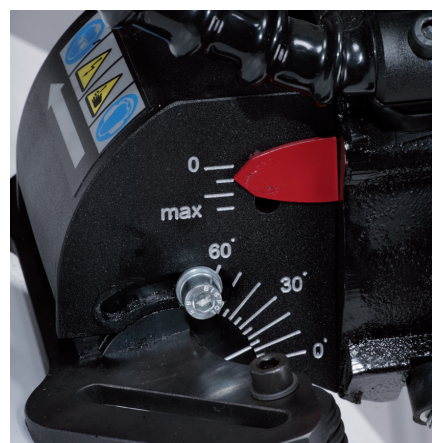
Fokozatmentes leélezési szög állítás 0-60°