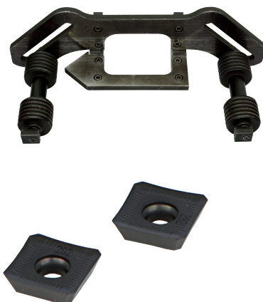
Váltólapka, 10 db/csomag Cikkszám: PT-PLY000282