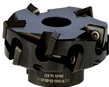
Egy részes marófej 10 váltólapkával

Univerzális megvezető, támasztó készülék alapfelszerelésként, lemezekhez és csövekhez Ø 150-300 mm