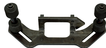
Opcionálisan kapható vezető készülék csövekhez, Ø 260-600 mm Cikkszám: PT-PRW04612200000